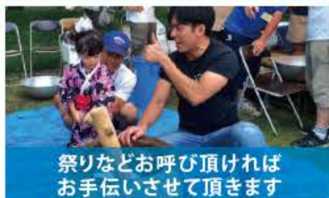
祭りなどお呼び頂ければお手伝いさせていただきます