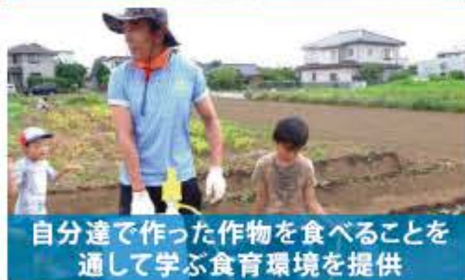
自分達で作った作物を食べることを通して学ぶ食育環境を提供