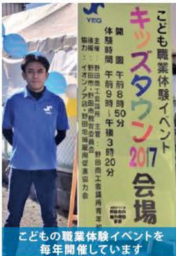
こどもの職業体験イベントを毎年開催しています