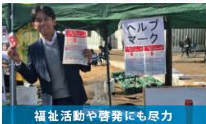
福祉活動や啓発にも尽力