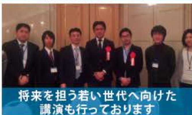
将来を担う若い世代へ向けた講演も行っております