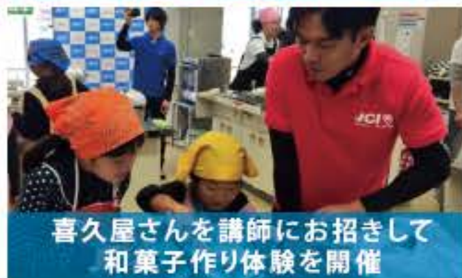
喜久屋さんを講師にお招きして和菓子作り体験を開催