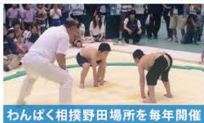
わんぱく相撲野田場所を毎年開催