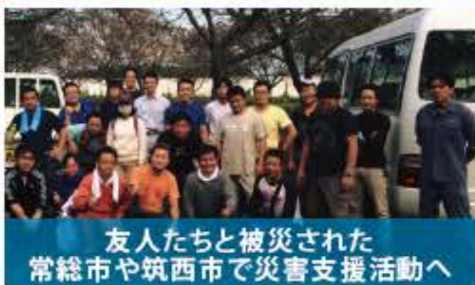
友人たちと被災された常総市や筑西市で災害支援活動へ