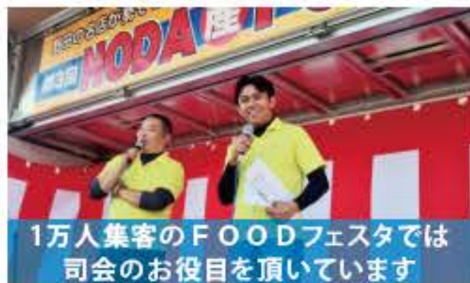
1万人集客のFOODフェスタでは司会のお役目を頂いています