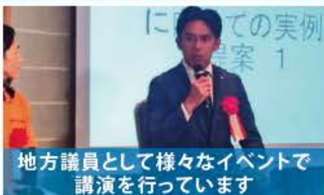
地方議員として様々なイベントで講演を行っています