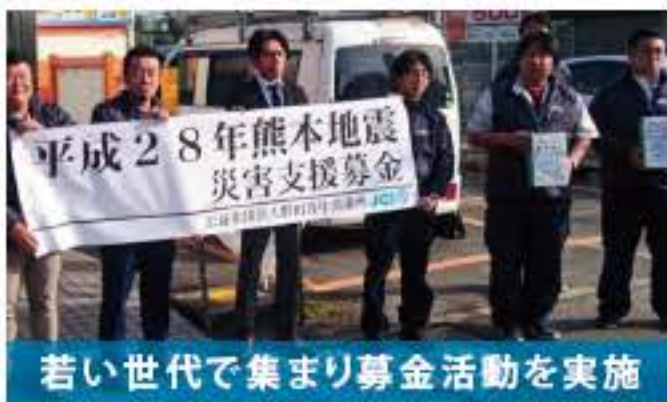
若い世代で集まり募金活動を実施